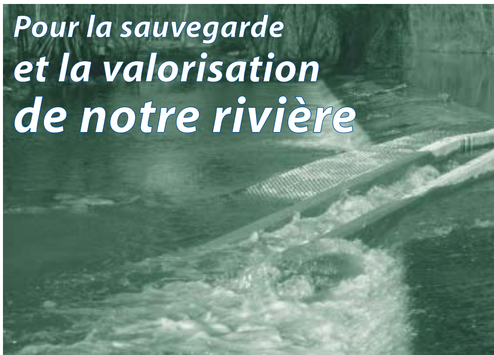
Passes de Foulpougne