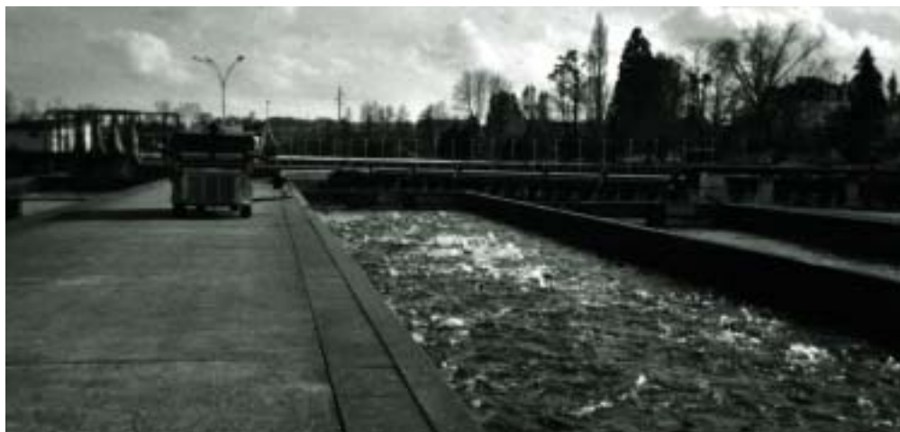
Distribution mécanique d'aliment à la pisciculture Viviers de France.

Les utilisateurs de la Touvre, associations et acteurs économiques, se mobilisent pour que les efforts de la collectivité ne soient pas vains et isolés. C'est ainsi qu'ensemble nous aurons une rivière à la hauteur de sa singularité.