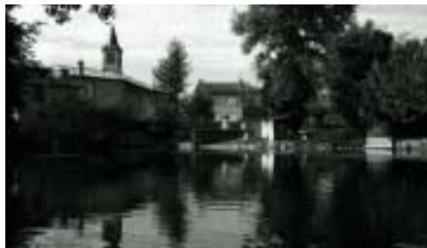
Ruelle vue de la rive gauche.

Tarif : 40 F/pers. Ces descentes peuvent être organisées d'autres soirs, pour des groupes constitués et sur demande.