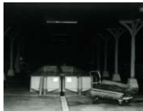
Alevinage en bassin couvert à la pisciculture Viviers de France.