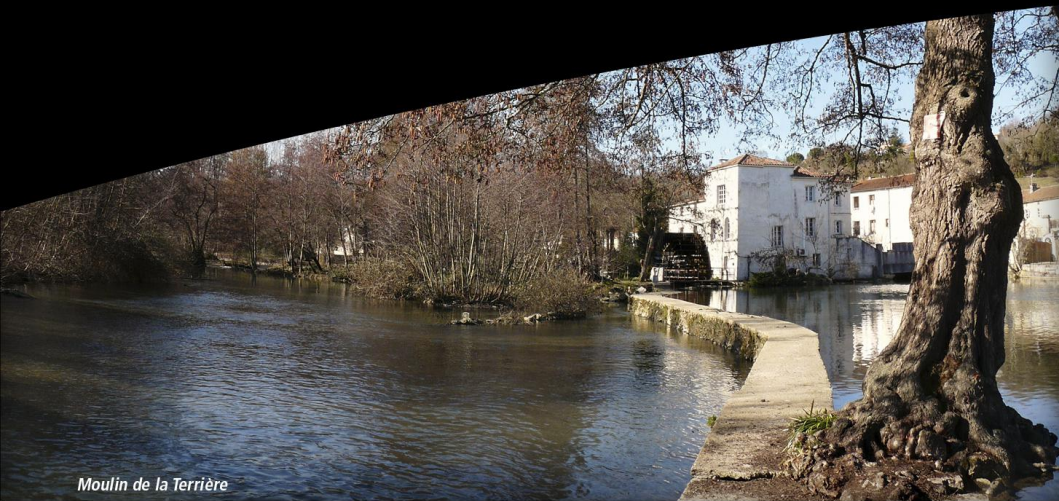
Moulin de la Terrière