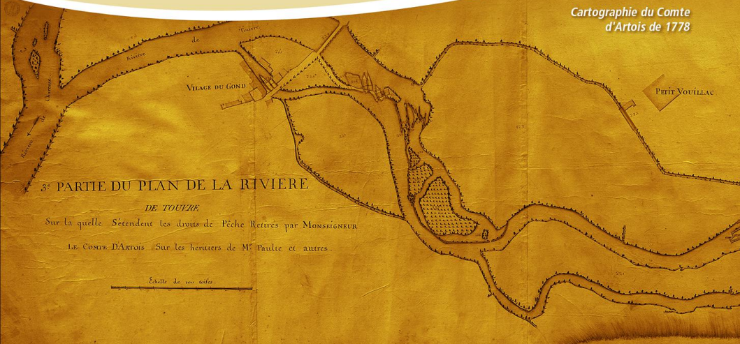
Cartographie du Comte d'Artois de 1778