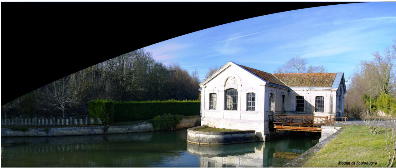
Moulin de Foulpougne